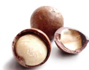
マカデミア種子油※5

高い保湿効果を持つ3種の植物性美容オイル※5を配合。たっぷりのうるおいで肌をやわらかく、なめらかに整えます。