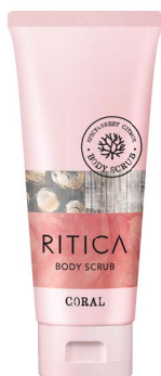
ボディフィットスクラブ コーラル 120g/1,500円(税抜)