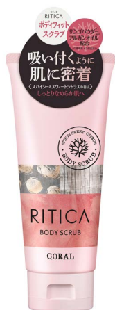
RITICA ボディフィットスクラブ コーラル 120g/1,500円(税抜) 2019年11月1日発売

自然の恵みのスクラブで肌を磨き上げるボディススクラブと ふんわりとろけるハンド&ボディクリームで、リフレッシュ&リラックス♪