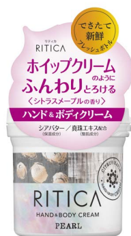
RITICA ハンド&ボディクリーム パール 120g/1,500円(税抜) 2019年11月1日発売

ロゼット株式会社は、自然の恵みから抽出された美容成分を配合したナチュラル志向のトータルボディケアブランド「RITICA (リティカ)」から、マイルドな使い心地の『ボディフィットスクラブ コーラル』と、ふんわりとろける使用感の『ハンド&ボディクリーム パール』を2019年11月1日より新発売いたします。