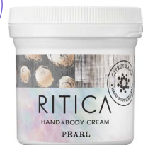
ハンド&ボディクリーム パール 120g/1,500円(税抜)