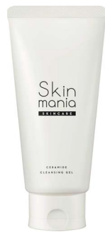
Skin mania セラミド クレンジングジェル 120g/1,200円(税抜)

天然セラミドと発酵セラミドのWセラミド配合によるトータルスキンケアブランド「Skin mania (スキンマニア)」を製造販売するロゼット株式会社は、「Skin mania セラミド クレンジングジェル」、「Skin mania セラミド 泡洗顔」を2020年6月2日(火)より全国のバラエティショップにて発売いたします *1 。