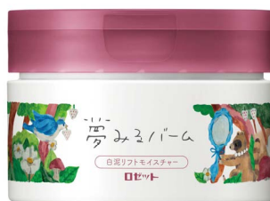
夢みるバーム 白泥リフトモイスチャー 90g/1,800円(税抜)

毎日しっかりメイクする20代～40代の大人女子にとって、メイクをきちんと落とせるクレンジングはスキンケアの中でも特に重要なもの。近年、多種多様なクレンジングアイテムがある一方で「オイルタイプはメイク落ちはいいけれど肌荒れしやすい…」、「クリームタイプは肌にやさしいけれどメイク落ちが物足りない…」などの声から、今急激にクレンジングバームの需要が高まっています。また最近では、毛穴ケア効果のあるクレンジングが好調な売上げを見せているように、メイク落ちだけでなく、プラスαの効果を備えた多機能で高機能なクレンジングが人気となっています。