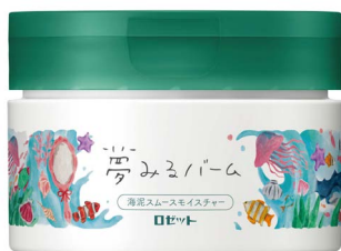
夢みるバーム 海泥スムーズモイスチャー 90g/1,800円(税抜)

ロゼット株式会社は、しっかりメイクで毎日頑張る20～40代の大人女子に向けて、メイクをしっかり落として肌悩みもケアするクレンジングバーム「夢みるバーム」を、2020年9月1日(火)より全国のドラッグストア、バラエティショップ(一部店舗を除く)にて発売いたします。