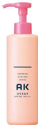
AK UVミルク (250mL)

ロゼット株式会社は、医療機関限定取扱いの高保湿スキンケアブランド「AK」から、天然セラミド ※1 を配合した低刺激性 ※2 の日やけ止め用乳液「AK UVミルク (250mL)」を2021年2月1日(月)より新発売いたします。