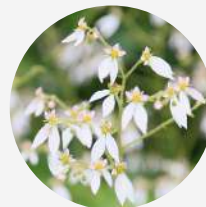
ユキノシタエキス *1