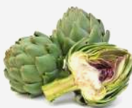
アーチチョーク葉エキス *1